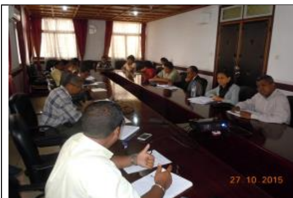
Rencontre institutionnelle avec les directions de l'administration centrale à la salle de réunion