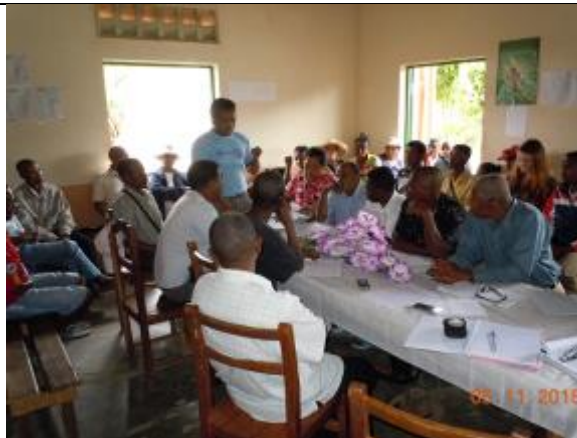
Consultation avec les populations acteurs producteurs de Litchi, girofle de la Commune Rurale d'Ampasimbe Manantsatrana