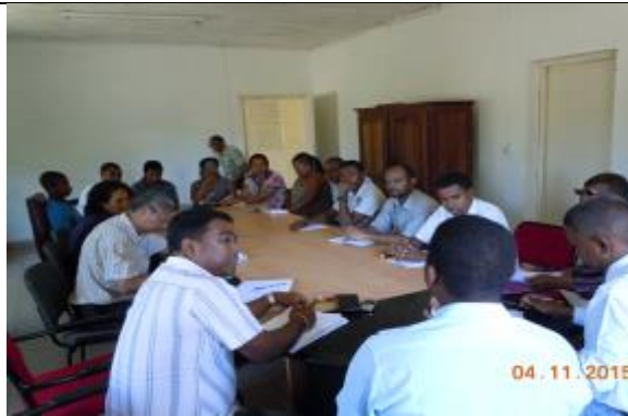
Rencontre avec les acteurs institutionnels de la Région Analanjirofo