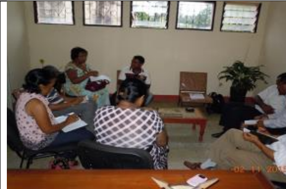
Rencontre avec les acteurs institutionnels régionaux à Atsinanana