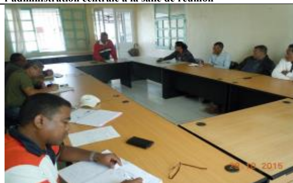
Rencontre avec les acteurs institutionnels régionaux d'Itasy