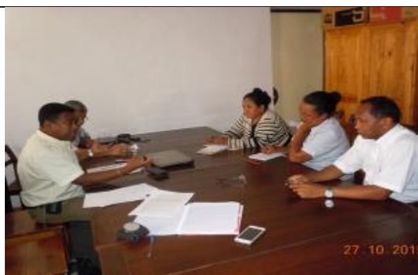
Rencontre avec les organisations de la société civile et la chambre de commerce à Antananarivo