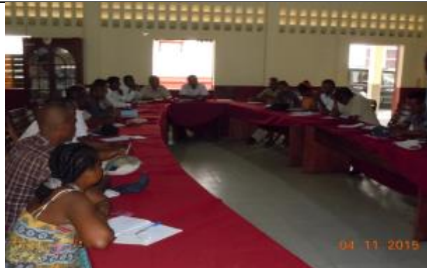
Rencontre avec les OP, les ONG, les collecteurs des filières girofle, vanille, épices Région Analanjirofo