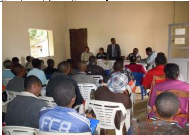
Consultation avec les populations acteurs producteurs de litchi et girofle commune rurale de Mahambo