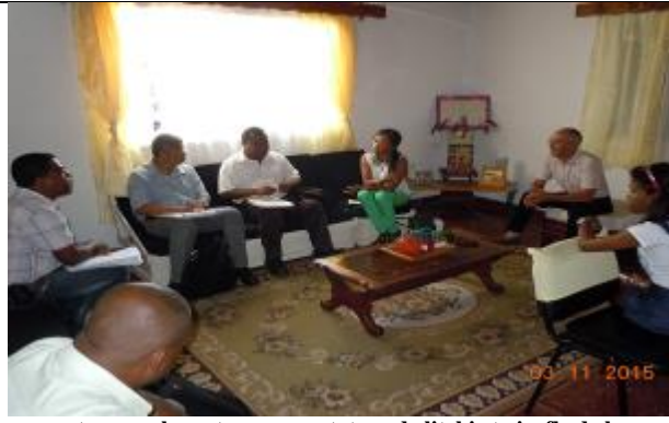
rencontre avec les acteurs exportateur de litchi et girofle de la Région Atsinanana