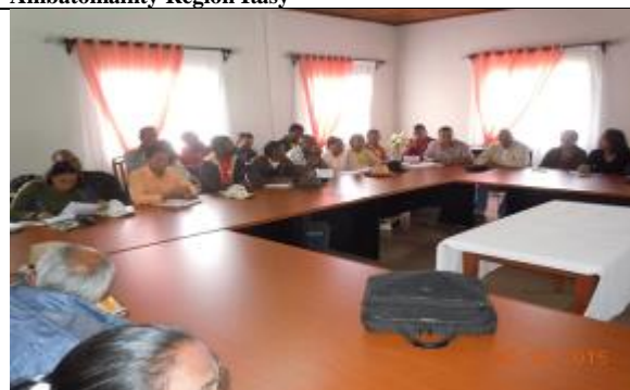
Rencontre avec les OP (filrière lait, fruits et légumes), les ONG, la société civile à Vakinankaratra