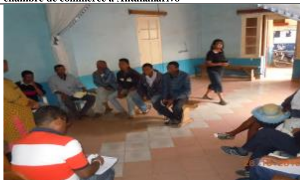
Consultation avec les organisations de producteurs de légumes (haricots) Commune Analavory, Région Itasy