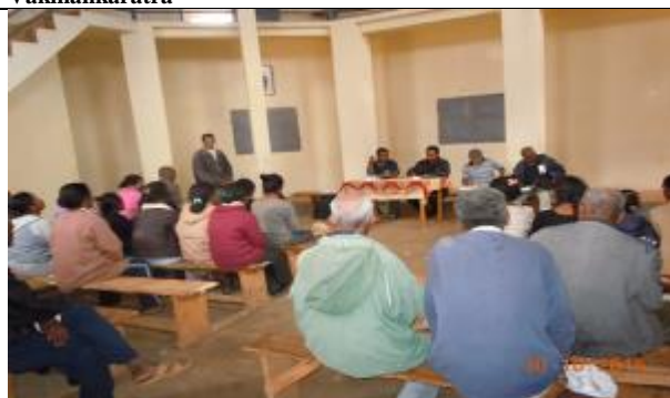
Consultation avec les acteurs producteurs filière légumes et lait commune rurale Ambano Région Vakinankaratra