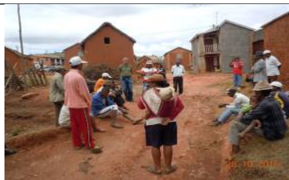
Consultation avec les producteurs de fruits village Ambatomainy Région Itasy