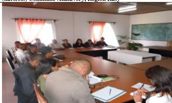
Rencontre avec les acteurs institutionnels régionaux Vakinankaratra